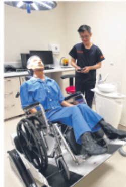
▲在中心新启用的设施包括该轮椅仰后系统，方便行动不便的患者看诊。

另外，国大牙医学院也会为应付更高的需求，增加学额，料从去年的60学额到2021年及之后的80学额。